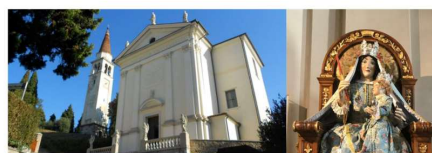
Santuario Madonna dell'acqua - Mussolente (VI)